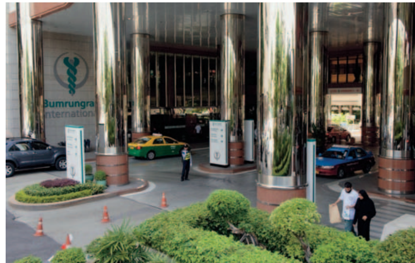
Bumrungrad International Hospital in Bangkok: Luxushotel mit Spitzenmedizin.