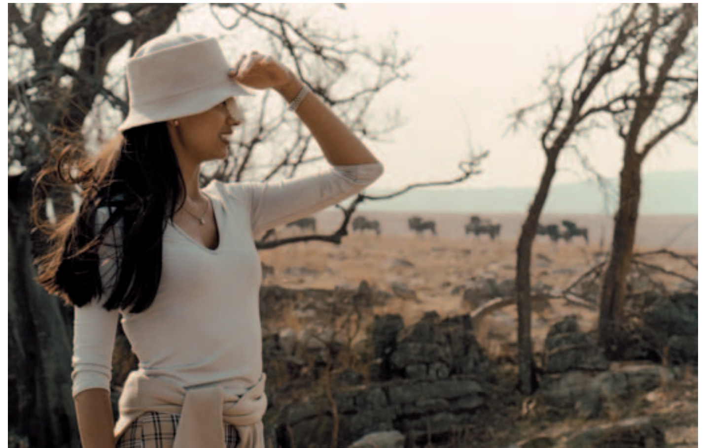
Nach der Nasenkorrektur auf Safari: Südafrika gilt als Topziel für Schönheitsoperationen.

In Europa und den USA sind in jüngster Zeit eine ganze Anzahl Unternehmen entstanden, die beim zukunftssträchtigen Geschäft mit dem globalen Patienten tüchtig mitverdienen wollen. Beispielsweise die französische Estetika Tour, die ihrer Kundenschaft Schönheitsoperationen in Tunesien mit anschliessenden Badeferien an der nordafrikanischen Küste anbietet. Oder Planet Hospital, die einen Katalog führt mit weltweit über 60 Destinationen für medizinische Eingriffe, darunter Prag für eine In-vitro-Fertilisation, Seoul für das Zusammennähen einer Jungfernhaut, Mexiko-Stadt für eine schönere Nase, Singapur für ein neues Herz und Mumbai für eine Organtransplantation. «Die Nachfrage nach unserer Dienstleistung steigt