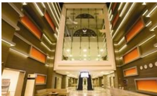
Der Innerraum vom Acibadem Maslak

Die ästhetische Operationen werden ausschliesslich von erfahrenen ästhetischen Chirurgen durchgeführt.